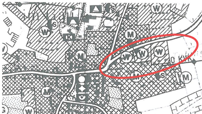
Ausschnitt aus dem Flächennutzungsplan

Der gültige Flächennutzungsplan weist im Plangebiet unterhalb der B 28 bestehende und zum Teil geplante Wohnbaufläche aus. Im südwestlichen Bereich bestehende Mischbebauung. Im östlichen Teil, im Bereich des geplanten Sondergebiets, ist eine Fläche für die Landwirtschaft ausgewiesen.