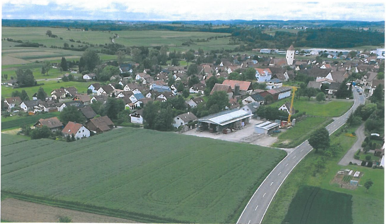
Blick von der B28 (Stuttgarter Straße) in Richtung Ortsmitte